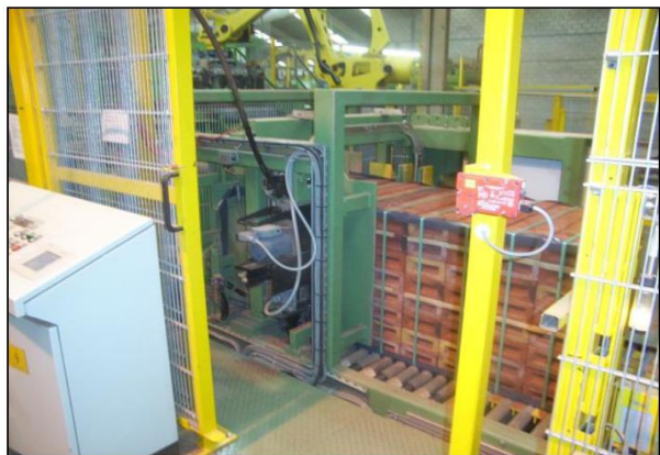
Возможна установка модуля головки Z-20, монтируемого сбоку, с удобным доступом, с двумя головками для скоростных вариантов