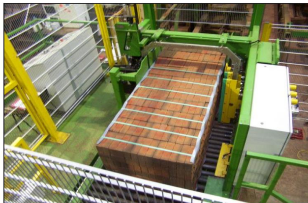
Плотно упакованный кирпич с увязкой 16-миллиметровой прочной полиэстеровой (PET) лентой Tenax

Компания оставляет за собой право вносить технические изменения без извещения клиентов